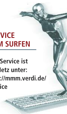
Grafik: Hermann Haubrich

Der Service ist im Netz unter: http://mmm.verdi.de/service